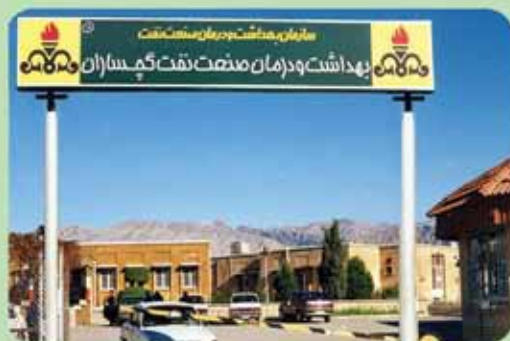
بهداشت و درمان صنعت نفت گچساران

صحیح مصرف کردن داروها یکی از مهم ترین عوامل مؤثر در درمان بیماری هاست.