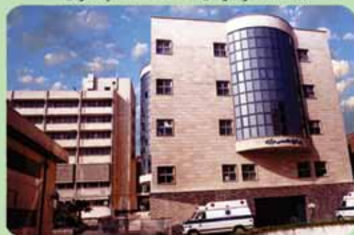
بیمارستان فوق تخصصی مرکز صنعت نفت تهران

روابط عمومی سازمان بهداشت و درمان صنعت نفت به صورت شبانه روزی آماده دریافت هرگونه انتقاد و پیشنهاد می باشد.