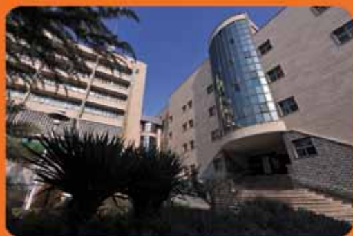
بیمارستان مرکزی صنعت نفت تهران

آمادگی درست بیمار یکی از مهم ترین عوامل در صحت نتایج آزمایشات است.