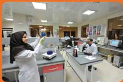
آزمایشگاه بیمارستان مرکزی صنعت نفت تهران

روابط عمومی سازمان بهداشت و درمان صنعت نفت به صورت شبانه روزی آماده دریافت هرگونه انتقاد و پیشنهاد می باشد.