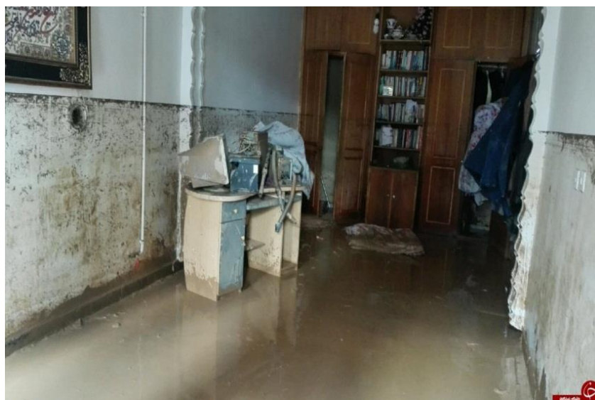
شکل ۹) خیس شدن دیوارها بعد از ورود سیلاب به داخل محل سکونت

تمام لایه‌های پوششی تزئینی مانند کاغذ دیواری و... که خیس (شکل ۹) شده‌اند به منظور تسریع در رسیدن هوا به سطح دیوار و خشک شدن آن باید از سطح دیوار کنده شوند. اغلب پوشش‌های مورد استفاده برای دیوارها در برابر آب مقاوم نبوده و غیر قابل استفاده می‌شوند.