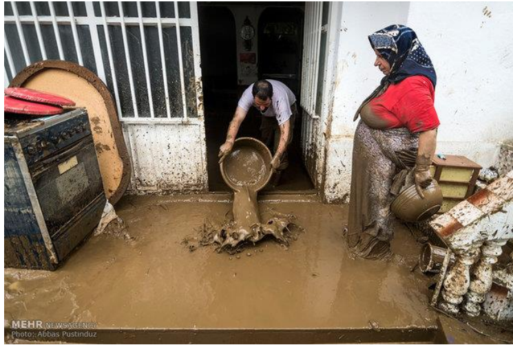
شکل (۱) تخلیه آب از داخل منزل

در صورتی که زیرزمین خانه پر از آب شده است بایستی تخلیه آب از زیرزمین با آرامی و به تدریج صورت گیرد. بهتر است هر روز یک سوم آب تخلیه شود چرا که تخلیه سریع زیرزمین باعث کاهش فشار هوا در زیرزمین در مقایسه با فشار وارده به دیوارهای آن شده و این مسئله می تواند باعث فروریختن دیوارها و بلکه ریزش ناگهانی ساختمان شود (شکل ۲).