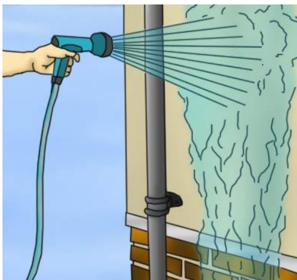
شکل ۱۰) شستشوی دیوار با استفاده از فشار آب و محلول‌های شستشو