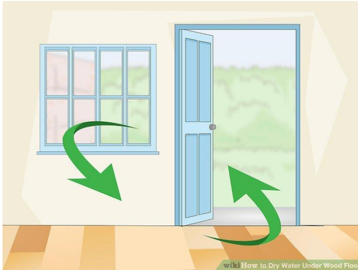
شکل ۱۴) بازگذاشتن درب و پنجره در طول روز برای تسریع کاهش رطوبت