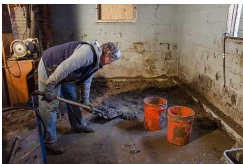
شکل ۶) تخلیه گل‌ولای با استفاده از وسائل ساده مثل سطل