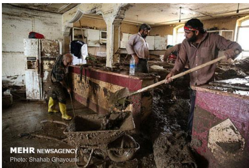
شکل ۵) تخلیه گل و لای با استفاده از فرغون

بعد از تخلیه کامل آب و تفکیک وسائل، قدم مهم بعدی خارج کردن گل‌ولای از محل سکونت قبل از خشک شدن آنهاست. در صورتی که حجم گل‌ولای انباشته شده زیاد است از وسائلی چون بیل، فرغون (شکل ۵) و سطل (شکل ۶) برای تخلیه استفاده کنید. در صورت امکان می‌توانید از یک شیلنگ و با فشار آب نیز برای خارج کردن گل‌ولای باقیمانده استفاده کنید. سعی کنید هرچه سریعتر رسوبات انباشت شده را از داخل منزل تخلیه کنید چون هرچه این رسوبات دیرتر تخلیه شوند به علت از دست دادن رطوبت سفت‌تر شده و به سختی تخلیه خواهند شد (شکل ۷).