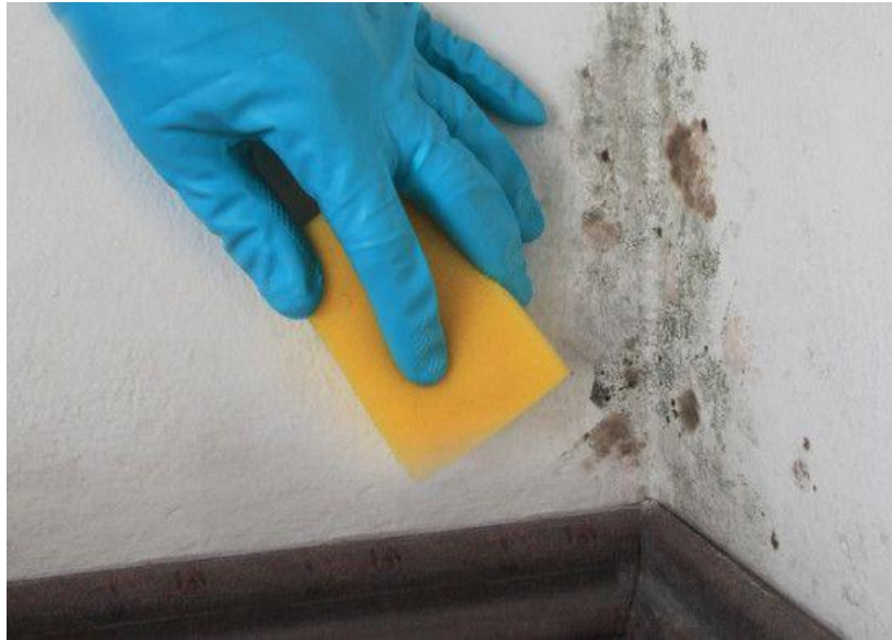
شکل (۱۱) ضد عفونی دیوارها با استفاده از وایتکس به کمک اسکاچ و دستکش