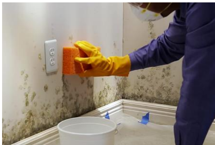
شکل ۱۶) تمیز کردن کپک با استفاده از محلول سفید کننده