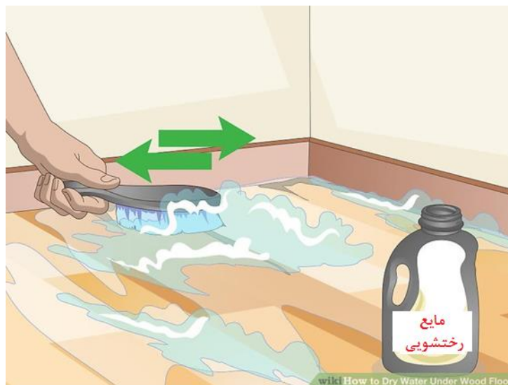
شکل (۱۲) تمیز کردن کف با فرچه و محلول شستشو (پودر یا مایع رختشویی)

برای جلوگیری از تشکیل کپک در سطوح کف خانه و یا کفپوشهای چوبی، سطح آنها را با فرچه مناسب (شکل ۱۲) تا حد اکثر ۴۸ ساعت بعد از سیلاب و به کمک مواد شستشو دهنده مانند پودر لباسشویی و یا تری سدیم فسفات ( ۴ تا ۶ قاشق غذاخوری در ۴ لیتر آب) یا سایر مواد شوینده فاقد آمونیم تمیز کنید.