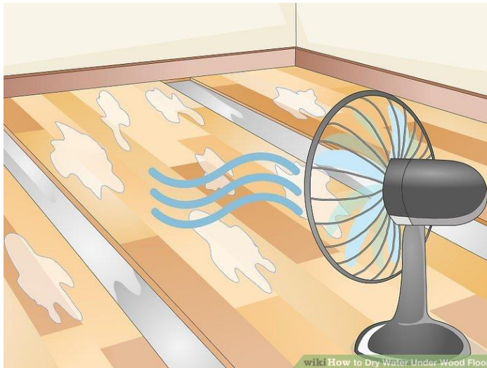
شکل ۱۳) برداشتن چند ردیف از پوششهای کف و خشک کردن آنها