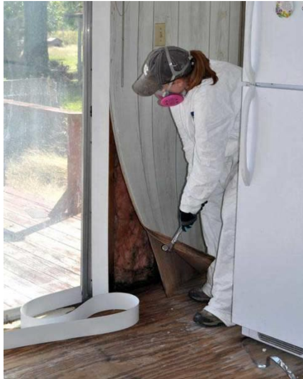
شکل ۸) برداشتن پوشش یا صفحات روی دیوار