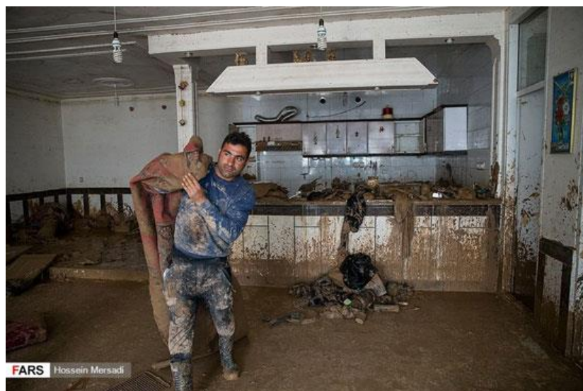
شکل ۴) خارج کردن وسائل خیس و آلوده از منزل