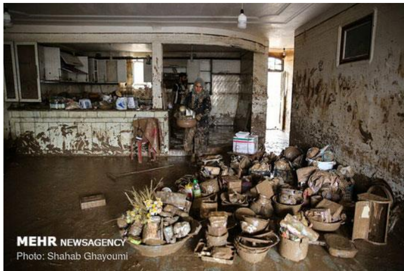
شکل ۳) تفکیک وسائل قابل استفاده مجدد

کلیه وسائل مربوط به آشپزخانه شامل ظروف و سایر وسائل کوچکی که قابلیت استفاده مجدد دارند را در یک محل مجزا از منزل یا خارج از منزل قرار دهید تا هر چه سریعتر نسبت به نظافت آنها اقدام کنید (شکل ۳). وسایل بزرگتر مانند فرش و مبلمان، میز و وسایل چوبی را که فضای بیشتری اشغال می کنند را به خارج از خانه انتقال دهید در صورتی که امکان استفاده مجدد از آنها وجود دارد در اولین فرصت نسبت به پاکسازی و نظافت آنها اقدام نمایید (شکل ۴).