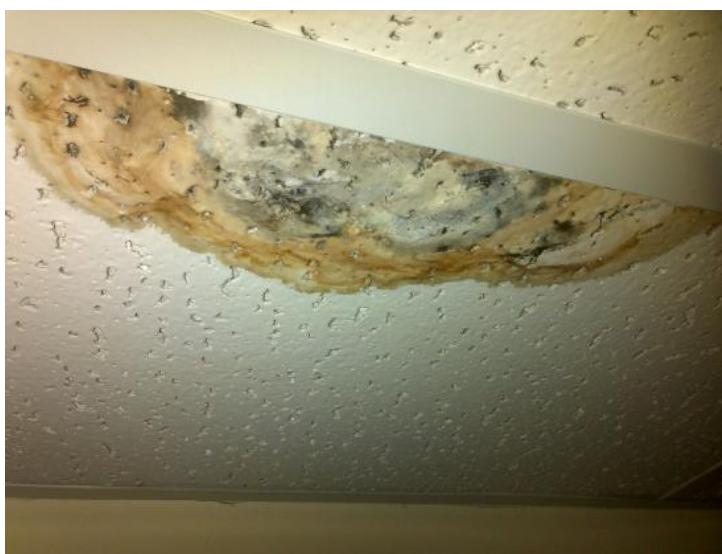
شکل ۱۷) رشد کپک در پوشش‌های متخلخل مورد استفاده در سقف