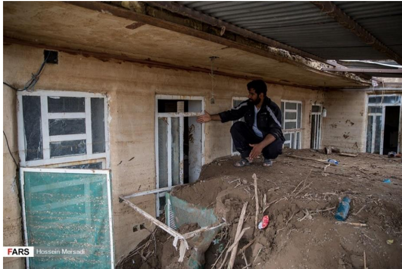
شکل ۷) سفت شدن انباشت رسوبات در یک منزل چند روز بعد از سیلاب